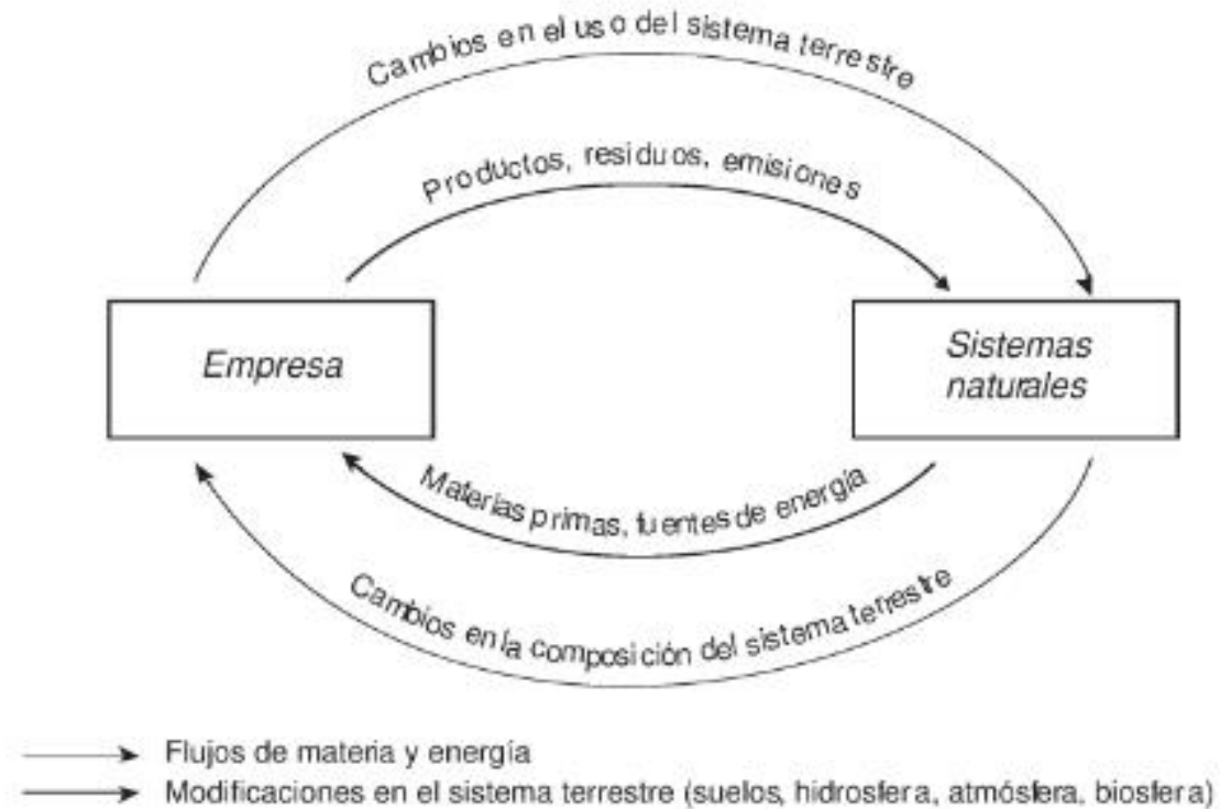
FIG. 1.3. La empresa y los sistemas naturales.